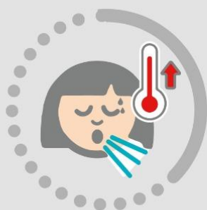
Fiebre y tos